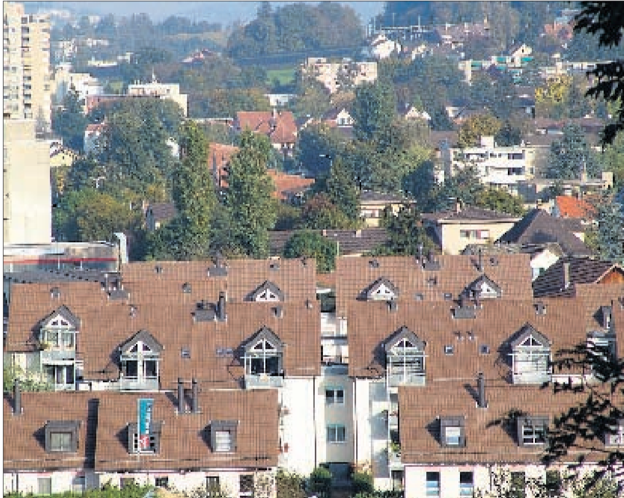
STEUERPOLITIK Wohin «steuern» die Urdorfer Einwohner, hier Sicht über Niederurdorf, mit ihrer Finanzplanung? FLAVIO FUOLI

depräsident von Affoltern am Albis, das im Steuerfussausgleich ist, bezeichnet diesen wie eine Erbteilung: «Es gibt viele Unzufriedene. Solche Instrumente sind gefährlich. Man versteht sie nicht, und es gibt nur wenige, die den Durchblick haben. Man verliert jede Autonomie als Gemeinde. Der Kanton diktiert sogar die Beiträge an Kinder für Schulager.» Affoltern beziehe bei einem Budget von 75 Millionen Franken 15 Millionen aus dem Steuerfussausgleich. Man